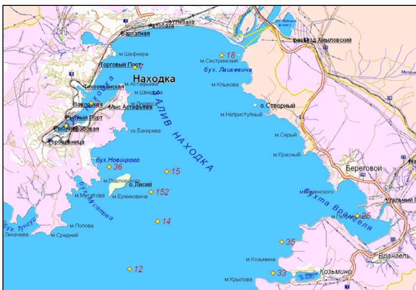
Рис. 12.6. Станции отбора проб в заливе Находка в 2009 г.

В 2009 г. гидрохимические наблюдения за состоянием акватории залива Находка проводились в октябре на 12 станциях ГСН (Рис. 12.6).