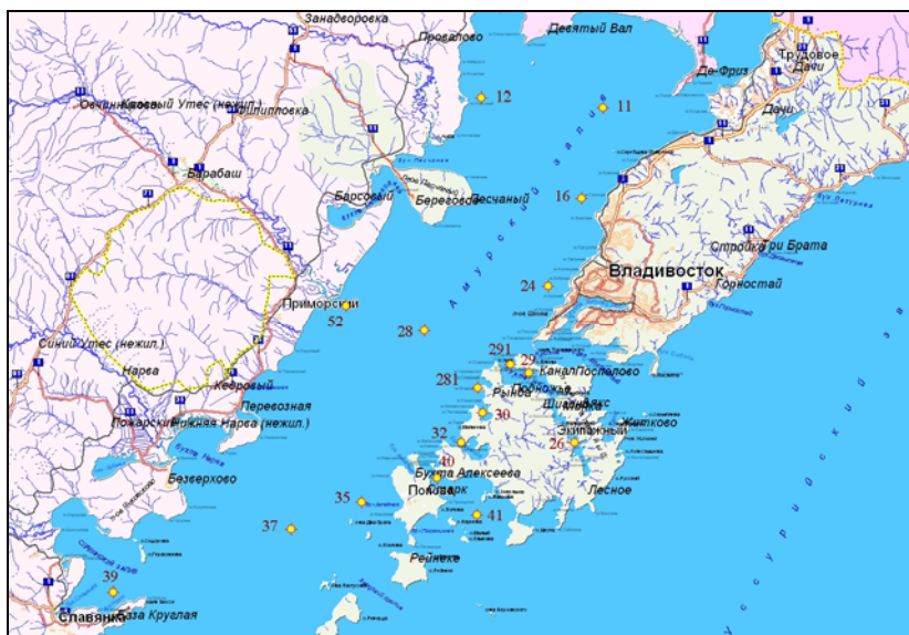
Рис. 12.3. Станции отбора проб в Амурском заливе в 2009 г.

0,35 мг/л (7 ПДК, в октябре на поверхностном горизонте на выходе из залива). Среднегодовая концентрация снизилась в 2,9 раза и составила 1,4 ПДК. Следует отметить, что по многолетним данным наиболее высокое загрязнение вод залива отмечается в весенне-летний период, а в 2009 г. именно в это время наблюдения не проводились. Превышение ПДК отмечено в 36% проб морской воды. Уровень загрязненности морских вод фенолами изменялся от 0,6 до 3,1 ПДК и составил в среднем 1,4 ПДК; максимум (3,1 мкг/л) ПДК был зафиксирован в октябре в поверхностном слое на выходе из залива. Превышение ПДК было отмечено в 63% проб.