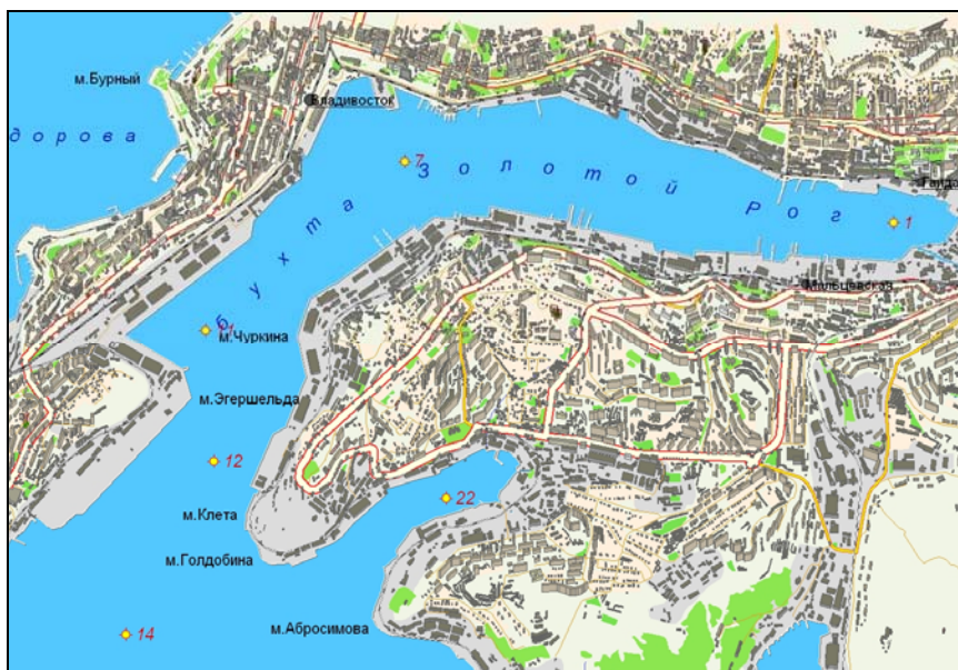
Рис. 12.1. Станции отбора проб в бухтах Золотой Рог и Диомид в 2009 г.

В 2009 г. гидрохимические исследования Японского моря проводились Центром мониторинга окружающей среды Приморского УГМС (г. Владивосток) в шести прибрежных районах залива Петра Великого: в бухтах Золотой Рог (5 станций, Рис. 12.1), Диомид и в проливе Босфор Восточный с июня по ноябрь, в Амурском заливе в сентябре и октябре, в Уссурийском заливе с августа по октябрь, и в заливе Находка наблюдения проводились в октябре. Работы осуществлялись в рамках программы Государственной системы наблюдений (ГСН) за состоянием загрязнения морских водных объектов.