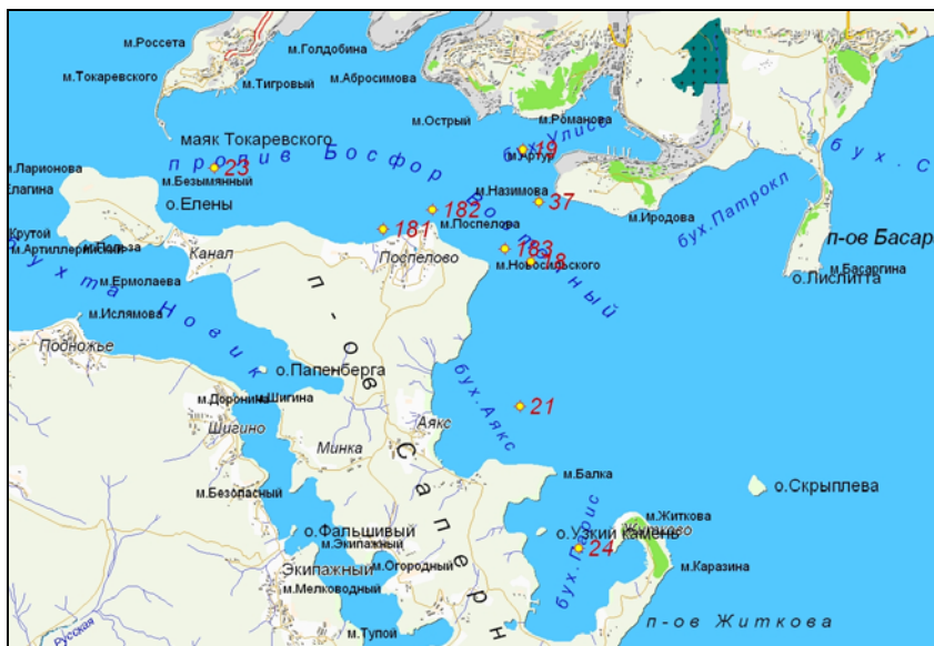
Рис. 12.2. Станции отбора проб в проливе Босфор Восточный в 2009 г.

сентябре; ДДТ (2,8 нг/л, снизилось в 2,1 раза) – там же в ноябре в промежуточном слое. По сравнению с 2008 г. в исследуемый период отмечен рост суммарного содержания группы ДДТ в 1,5 раза.