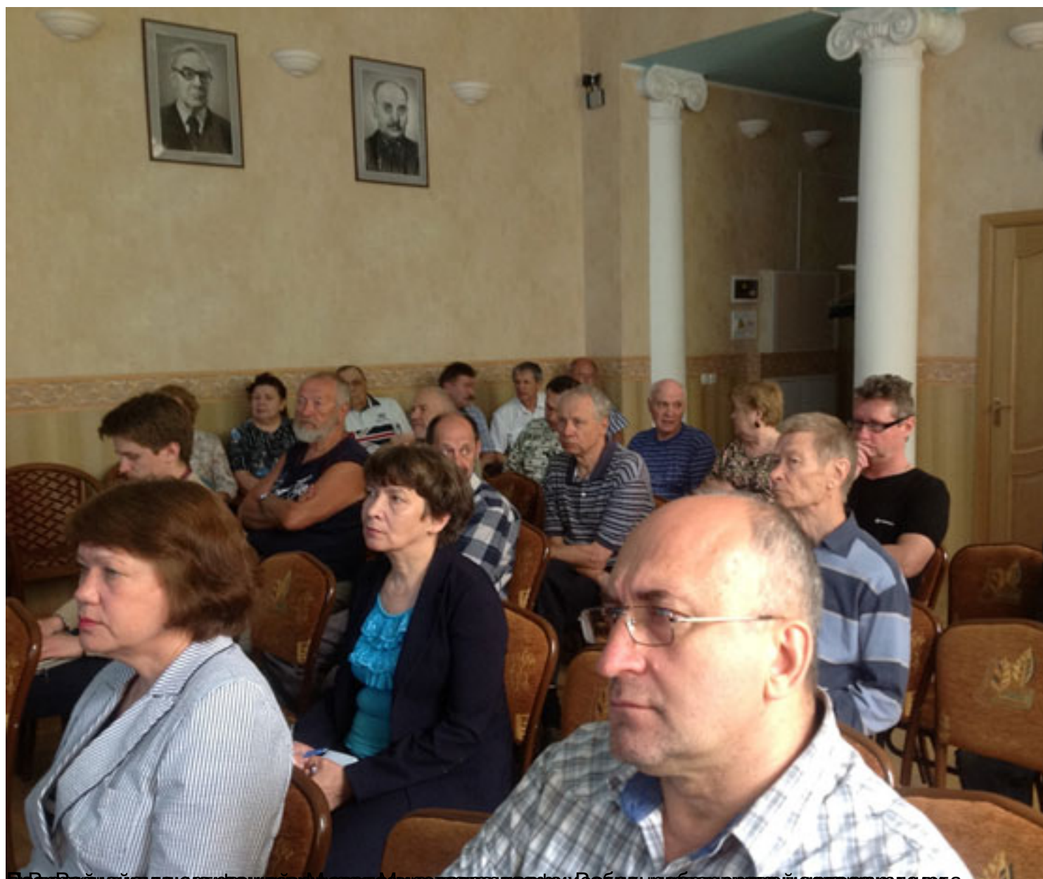
Подарок от лично куратору музея Морского вавва кафе и Гебрыца веморужна кверца лита