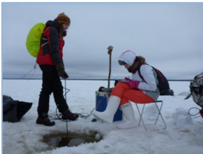
Зондирование температуры и солености