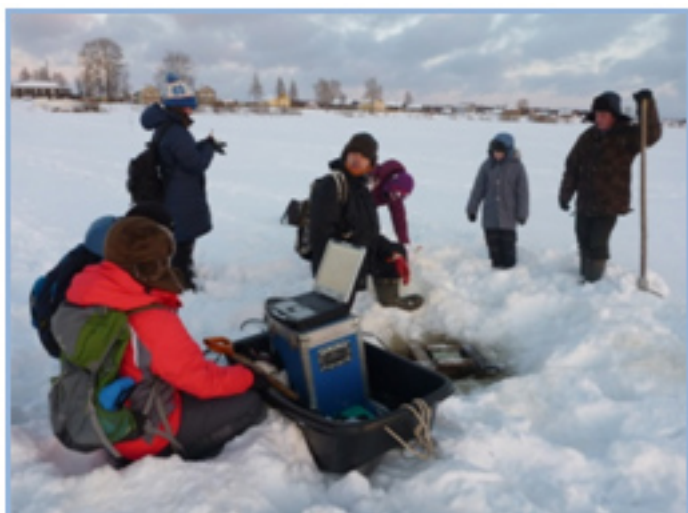
Измерение скоростей течения акустик-доплеровским профилографом