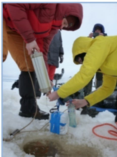
Отбор проб воды

С применением современного оборудования и приборной базы выявлены пространственно-временные закономерности гидрологического режима устьевом участка р. Онеги в условиях сплошного ледяного покрова толщиной более полуметра, сизигийных приливов, а также ветрового нагона.